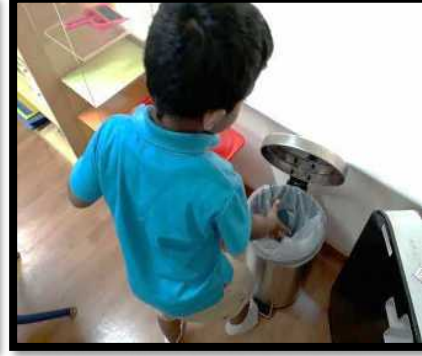
நடவடிக்கையைச் செய்த பின்னர், பிள்ளைகள் வகுப்பைச் சுத்தம் செய்தல்