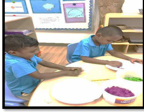
பிள்ளைகள் கைவினைப் பொருள் செய்ய களிமண்ணையும் வண்ணத்தாள்களையும் கொடுத்தல்