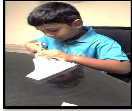
பிள்ளைகளுக்குப் பசை, கத்தரிக்கோல் போன்றவற்றைப் பயன்படுத்தப் கற்றுக்கொடுத்தல்